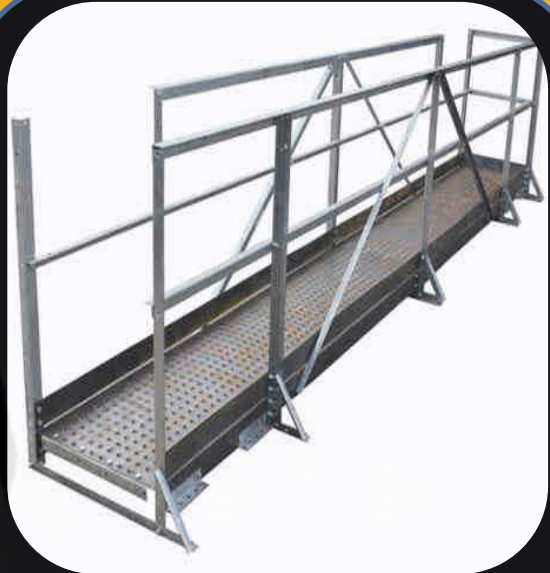
Sound attenuated, weatherproof Generator enclosures