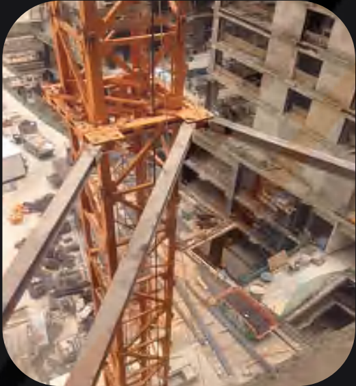
Tower Crane Tie Beams and Accessories