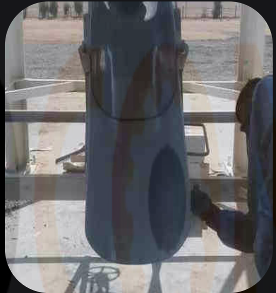
Cement Silos and Related Accessories