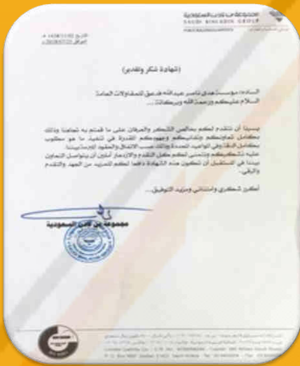
SAUDI BIN LADIN GROUP