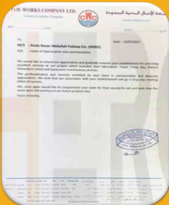
CIVIL WORKS COMPANY LTD