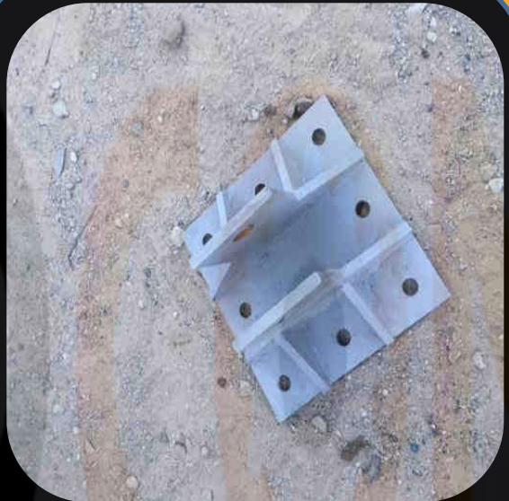
Custom-made steel parts for the construction industry