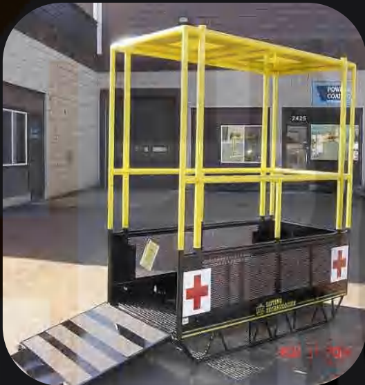
Material moving & Personnel Evacuation Baskets