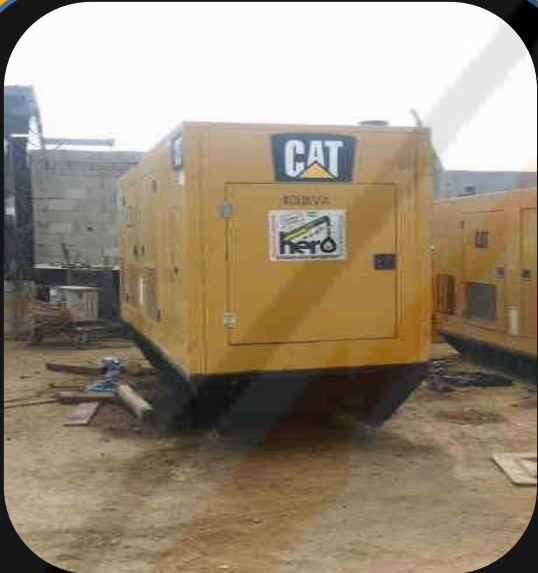
Sound attenuated, weatherproof Generator enclosures