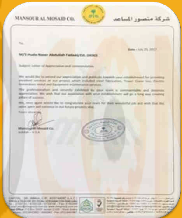
MANSOUR AL MOSAID CO.